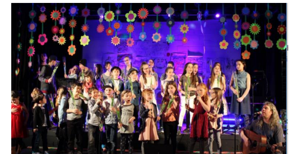
Comme chaque année, le spectacle de la Relève culturelle de Champlain, qui a eu lieu le 14 avril, fut un succès. Une belle soirée passée avec nos jeunes remplis de talent. Un grand merci aux organisateurs qui leur ont permis de vivre une expérience de vie exceptionnelle. Tous les fonds recueillis serviront à financer les activités de Phares sur Champlain.